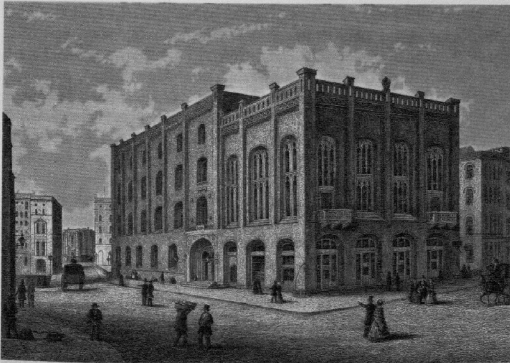
Abb. 1: Haus der Patriotischen Gesellschaft. Mit der Patriotischen Gesellschaft von 1765 begann die Geschichte des Gewerbeschulwesens. In ihrem Haus an der Trostbrücke fand bis 1876 privater gewerblicher Unterricht für Lehrlinge und junge Handwerker statt. Lithographie von J. Gray, um 1852

fördere: „Das Letztere geschieht nun in Hamburg unbezweifelt vorzugsweise durch Beseitigung all und jeder Hemmnisse des Handels, aber doch nicht ausschließlich. Die Gewerbetreibenden bilden einen zahlreichen und achtungswerthen Bestandtheil der Bürger und es würde eine arge Einseitigkeit sein, neben der Förderung des Handels nicht auch den Gewerben allen möglichen Vorschub zu leisten.“ 29