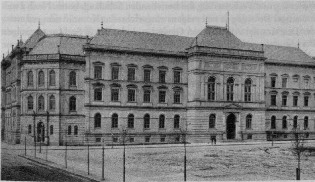
Abb. 2: Heutiges Museum für Kunst und Gewerbe, früher Allgemeine Gewerbeschule. Für das seit 1865 staatliche Gewerbeschulwesen wurde 1870 der Neubau einer Allgemeinen Gewerbeschule samt eines gewerblichen Museums beschlossen und 1876 eingeweiht – heute beherbergt dieses Gebäude am Steintor ausschließlich das Museum für Kunst und Gewerbe. Fotografie um 1880

hinein Fachschule blieb und erst 1960 den Rang einer Ingenieurschule erhielt. 57